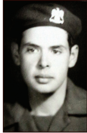
جندي مقاتل مؤهلات عليا

كانت لي تجربتي الخاصة في التعامل مع الواقع على الأرض .. تلك التجربة التي جعلتني لا أتقبل بسهولة الشهادات عن واقعة محددة دون تمحيص كاف، وأن أضع في اعتباري موقع الرؤية للشاهد، ومسافة الرؤية، ومنظور الرؤية، وزاوية الرؤية ومدى اتساعها أو انحسارها؛ فقد تم تجنيدي في ٢ أبريل ١٩٧٧ جنديا مقاتلا مؤهلات عليا بالقوات المسلحة بعد سنوات قليلة من حرب أكتوبر، وتم إلحاقني على الفرقة ٢٣ قتال بالجيش الثاني الميداني بأحد التشكيلات القتالية بأحد ألوية المشاة الميكانيكية الرابضة في القطاع الأوسط بين الدفرسوار وأبو سلطان حيث وقعت الثغرة .. كانت ذاكرة من التقيت بهم مازالت طازجة ..