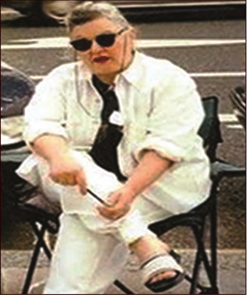
آخر صورة التقطت للفنانة سعاد حسني قبل رحيلها