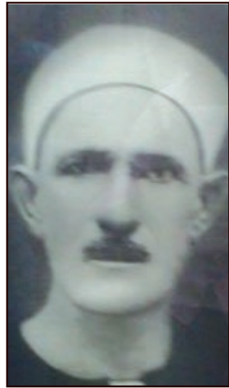
الشيخ علي عامر عمدة أسطال ووالد المشير عبد الحكيم عامر

كان المشير عامر واثقاً أن ناصر في النهاية سيدعن لطلبه، وكان متأكداً أنه لن يغدر به؛ لأن والده الشيخ علي عامر عمدة أسطال قد جعلهما يقسمان على المصحف بألا يغدر أحدهما بالآخر !!، وبالتأكيد لم يكن المشير يدرك أن زمن «العهود» قد انقضى وولى إلى غير رجعة وأن عبد الناصر قد اتخذ قراراً بتحديد إقامة عامر، وأعد العدة لتنفيذ الخطة التي أطلق عليها اسماً حركياً: «جونسون» للقبض عليه أثناء عودته من سهراته الليلية مسطولاً مع ثلة من الضباط في ضاحية مصر الجديدة .. كانت الخطة تقضي بإلقاء القبض عليه في طريق صلاح سالم أمام القلعة، ولكن أمين هويدي مدير المخابرات الأسبق في كتابه بعنوان: «مع عبد الناصر» أكد أن تلك الخطة كانت مُعرضة للفشل بسبب أن المشير ربما لا يكون مسطولاً بالقدر الكافي بما يقوي احتمال مقاومة المشير بما يلفت انتباه بعض