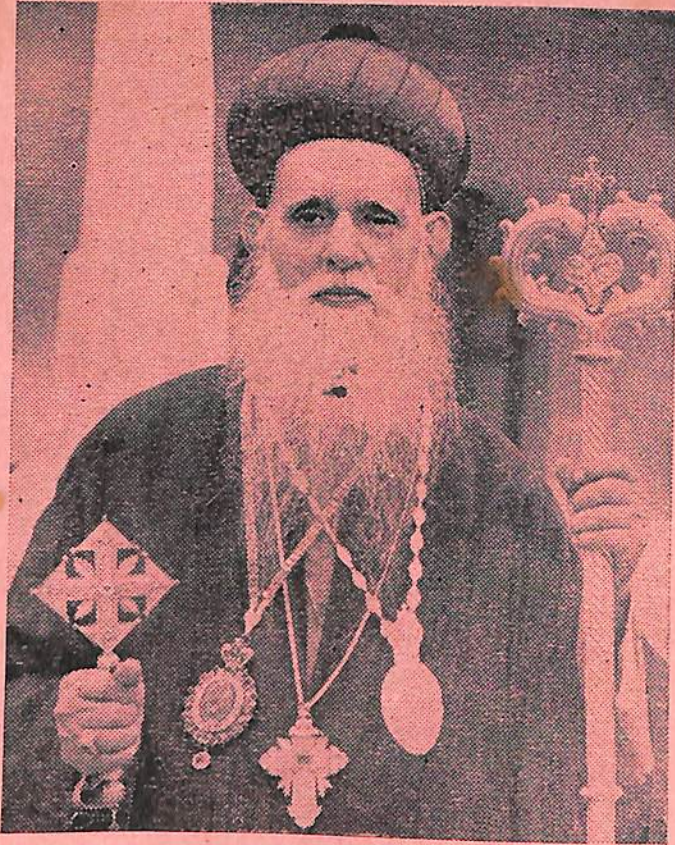
നി. വ. ടി. മ. ശ്രീ. മോറാൻ മാർ ബെസ്സിലിയോസ് ഗീവറഗീസ് II